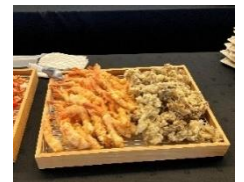
TOREI×パルちゃん特選寿司と神の海老