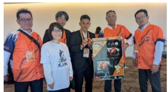
昨年、現役を引退されたサッカー元日本代表「テル」こと伊東 輝悦さん 「マイアミの奇跡」で王者ブラジルに決勝ゴールで歴史的な勝利を導く 2月に清水エスパルス アンバサダー兼 教育事業部コーチにご就任