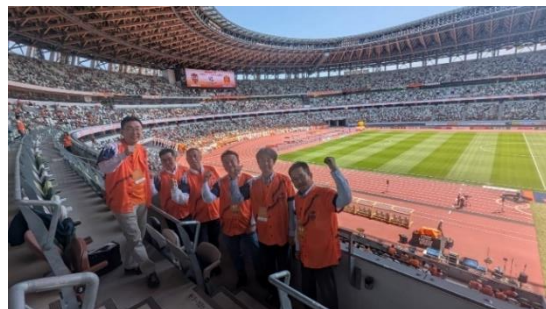
TOREI 役員・社員がスタジアム・TV 中継等で全力応援！