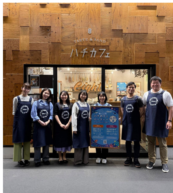
イベントを企画・運営した社員

今後もこのような取り組みを通じて、ステークホルダーの皆様とともに、魚食文化の未来を築いていきたいと考えております。