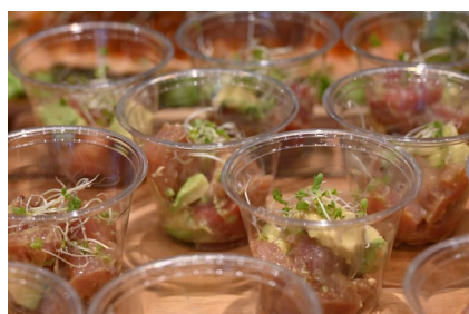
キハダマグロのポキ