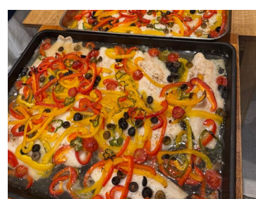
パンガシウスのアクアパッツァ